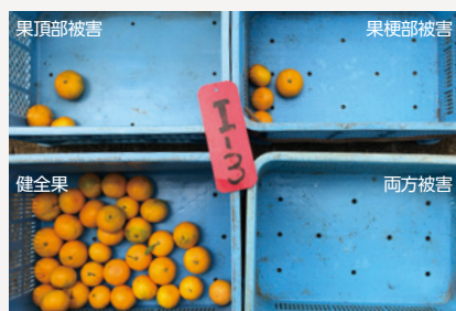
グレーシアフロアブル