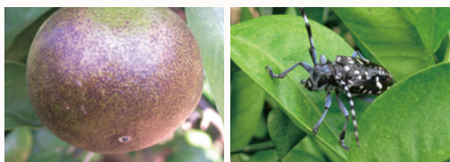
ミカンサビダニ被害